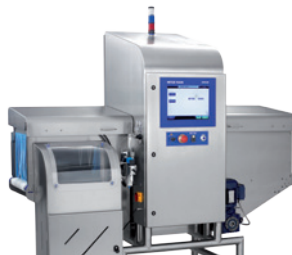
Rentgenové kontrolní systémy