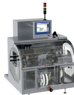
Systémy pro sledování a dohledatelnost