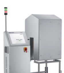
Optické kontrolní systémy