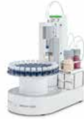
InMotion™ KF オープンオートサンプラー