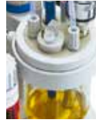
アダプタセット KinematicaまたはIKAホモジナイザ用