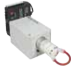
TV6バルブ 液体サンプリングバルブ