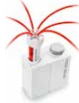
DispenseSix リキッドハンドラー