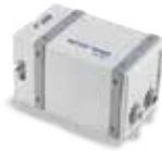
SD660 メンブレンポンプ