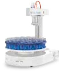
InMotion™ オートサンプラー