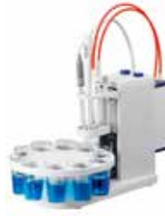
Rondolino 自動滴定スタンド