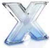
PCソフトウェア 滴定ソフトウェアLabX® Server 滴定ソフトウェアLabX® Express